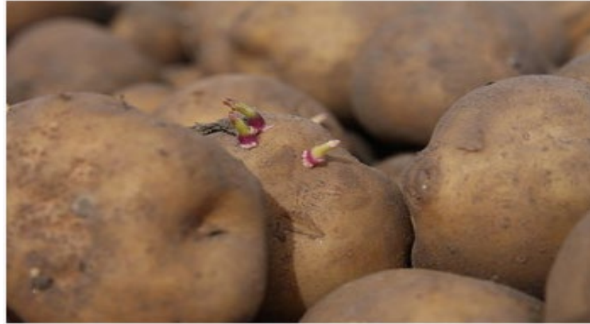
Pommes de terre 'Amflora' germées