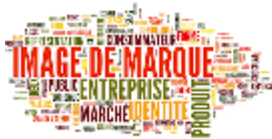
Image de marque: Une réputation d'excellence en matière de qualité peut devenir un avantage concurrentiel distinctif pour une entreprise. Les consommateurs sont souvent prêts à payer une prime pour des produits ou des services de qualité supérieure, ce qui peut augmenter la rentabilité.